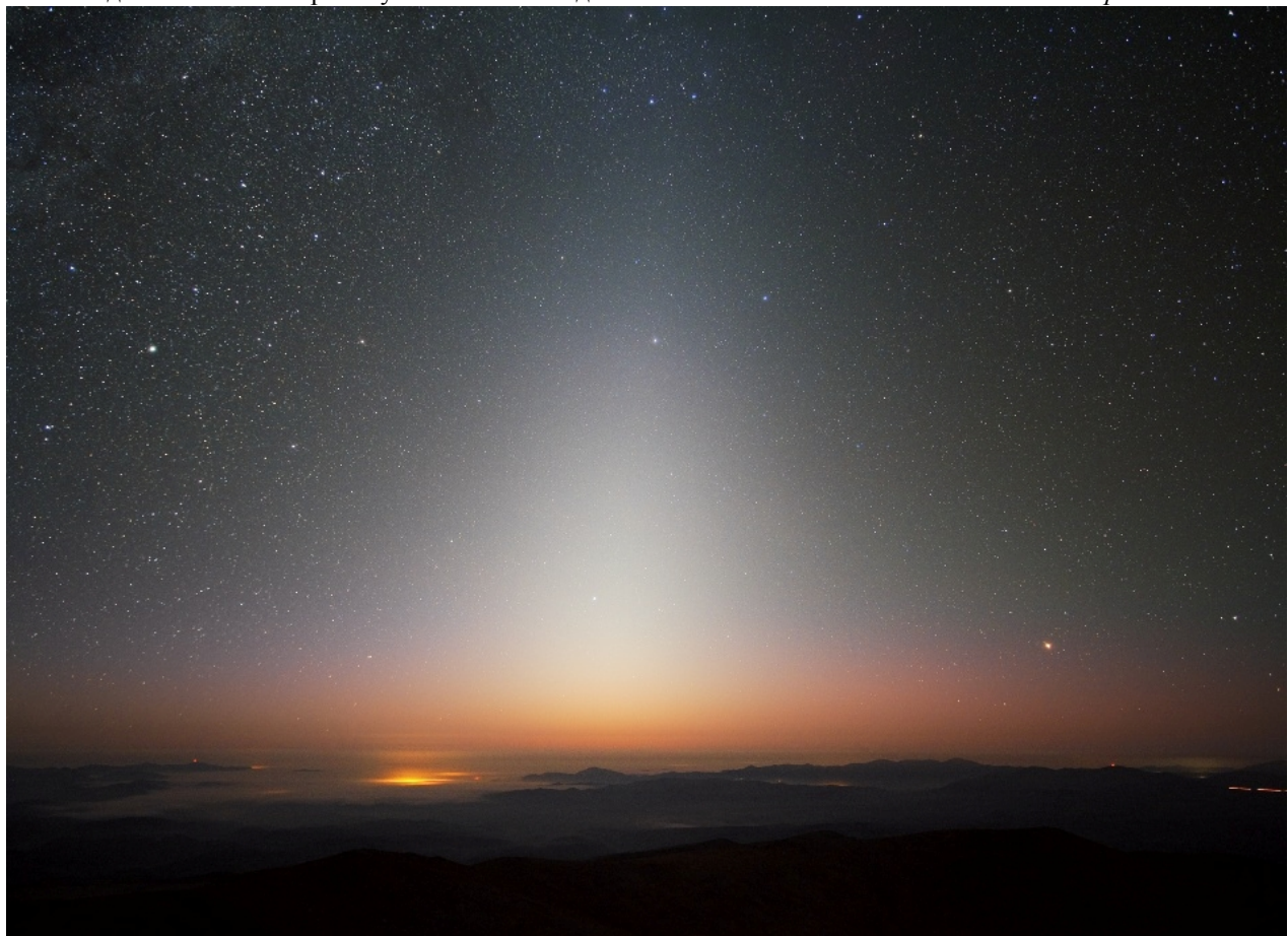
Зодиакальный свет. Снимок Юрия Белецкого (Garmisch) (с) http://www.astronomy.ru/forum/