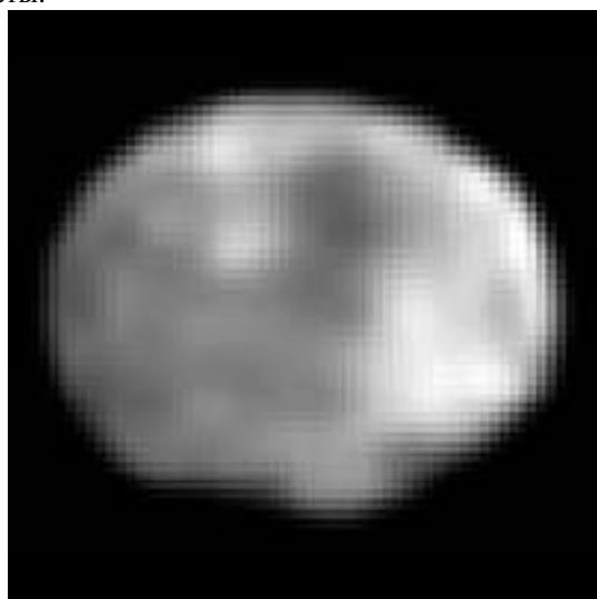
Астероид (4) Веста по снимку космического телескопа им. Э. Хаббла

Веста является единственным астероидом, который пери-одически можно без особых усилий (в хороших относительно засветки условиях, конечно) наблюдать невооружённым глазом при блеске чуть слабее 5^m . Хотя он и не самый большой, но обладает значительной отражательной способностью (альбедо), благодаря чему становится столь ярким. Ярче Весты могут быть лишь очень редкие околоземные астероиды (например, астероид Апофис в 2029 году, который достигнет яркости 3-4^m ). Астероид был открыт 29 марта 1807 года Генрихом Вильгельмом Ольберсом и по предложению Карла Гаусса получил имя древнеримской богини дома и домашнего очага Весты.