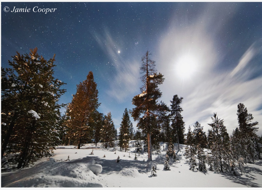
Зимняя ночь в Финляндии